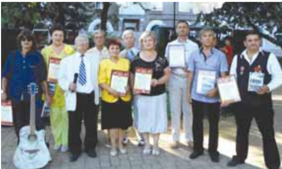
Члены МАПБИМ на празднике «Театрального сквера» в городе Донецке

Традиционно, как это бывает каждый год, писатели-баталисты ДНР приняли активное участие в Днях шахтёра и г. Донецка. Они стали лауреатами