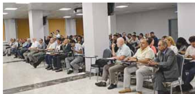
Участники российско-афганского литературного вечера, организованного Центром диаспор Афганистана