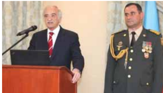
Чрезвычайный и Полномочный Посол Азербайджанской Республики в России Полад Бюльбюль оглы и военный атташе при посольстве Азербайджана в России полковник Надир Шахбазов

В Москве состоялся торжественный прием по случаю 100-летнего юбилея Вооружённых Сил Азербайджанской Республики. Его открыл Чрезвычайный и Полномочный Посол Азербайджанской Республики в России Полад Бюльбюль оглы, который отметил, что столетие армии представляет собой очень важное событие в жизни каждого государства, каждого народа. «В России есть очень правильная мысль: самый большой друг государства – это армия и флот. Это действительно так. Если хочешь быть действительно независимым, у тебя должна быть сильная армия, иначе трудно быть независимым», – сказал дипломат. Он рассказал, что присутствовал на параде, прошедшем в Баку в честь 100-летнего юбилея Вооружённых сил Азербайджана, где выступил Верховный главнокомандующий, Президент страны Ильхам Алиев и состоялся показ военной техники. «Когда я находился на трибуне и наши brave солдаты, офицеры, представлявшие различные рода войск маршировали, то с чувством большой гордости смотрел на это. А потом, когда пошла техника, самая современная, самая нужная, закупленная в разных странах, из разных источников, я понял, что, действительно, наша Азербайджанская армия сегодня, спустя сто лет, может отразить любую агрессию и выполнить любое поручение Главнокомандующего», – сказал он.